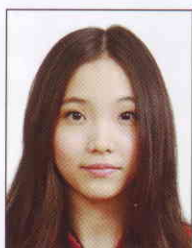
頭髮遮蔽 到眼睛或 耳朵