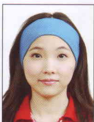
臉部及雙 耳被物品 遮蔽