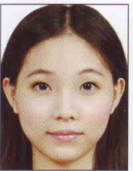
頭髮碰觸到 照片邊框