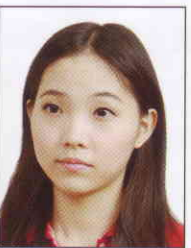
頭部側向 一邊、未 正視鏡頭